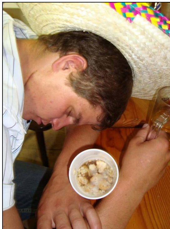
Sportler trinken Rivella und Loch Dan trinkt ein schäumendes Gebräu mit Bröcken.