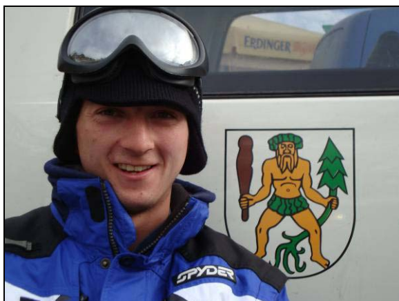
Ein Bild für die Ewigkeit: Das Grabser Manndli mit seinem grossen Vorbild