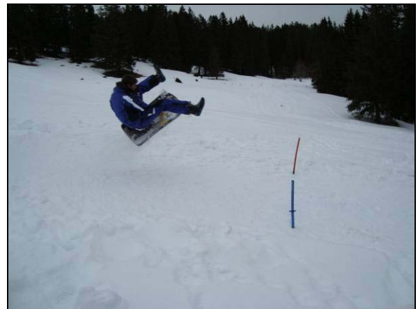
und Loch Dan macht den Pilotenschein.