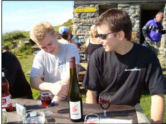
Bös und Winggel This geniessen ein Glas Rotwein auf dem Alvier.