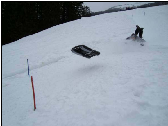
Forst Thisli kam für einmal zu Fuss in's Ziel...