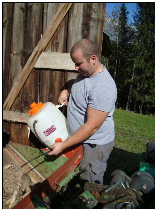
Striggi Original arbeitet gewissenhaft und konzentriert an einer wichtigen Aufgabe.